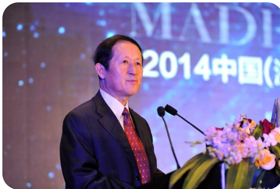
孙晓华 全国工商联副主席