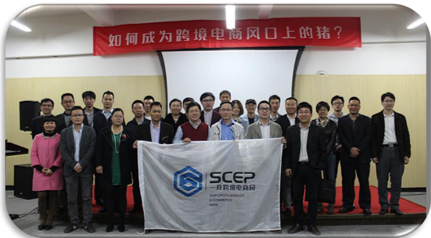
11.14跨境电商主题沙龙合照