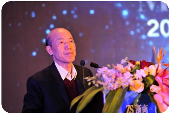
徐鸿道 第九届浙江省政协副主席