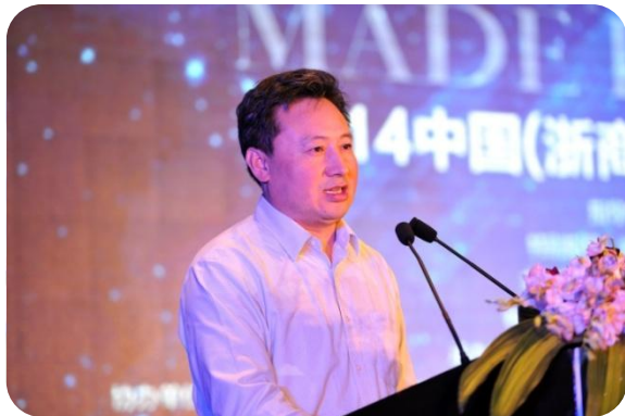
付诚 商务部中国电子商务中心副主任